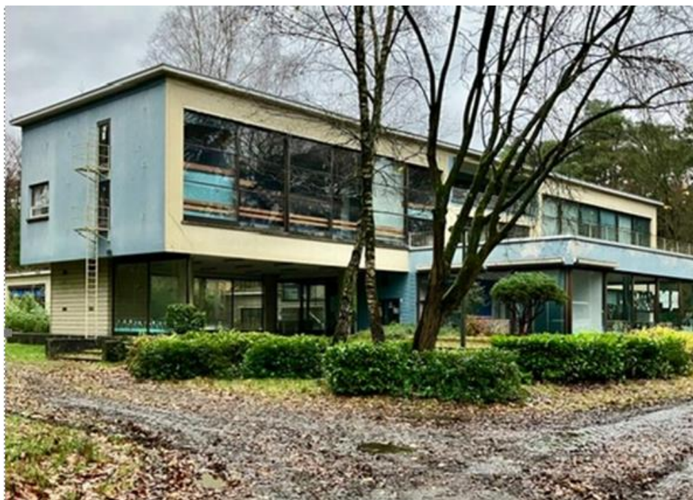
Afbeelding 1: Het kindersanatorium Hof Ten Bos, ontwerp van 1937 naar ontwerp van L. Stynen