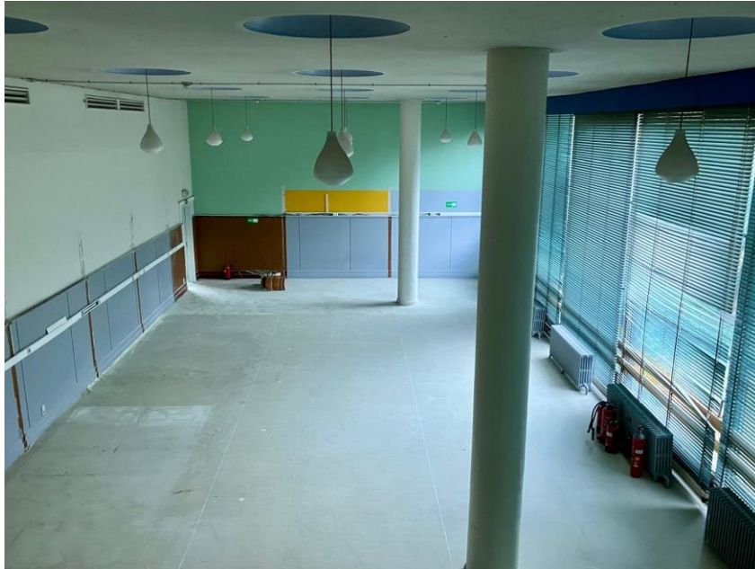
Afbeelding 6: detail interieur