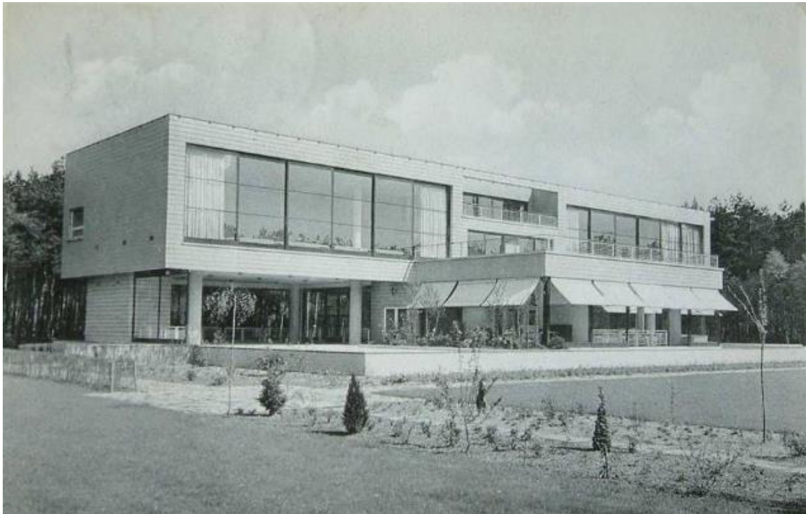
Afbeelding 4: Postkaart uit 1951