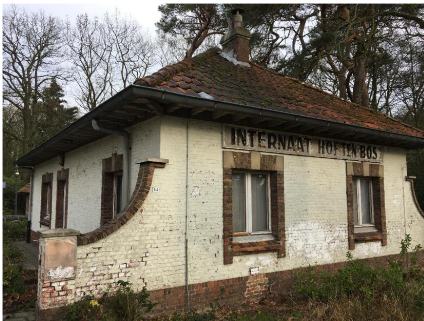
Afbeelding 7: conciërgewoning rechts

Bezichtiging mogelijk na afspraak: HOU MIJ OP DE HOOGTE