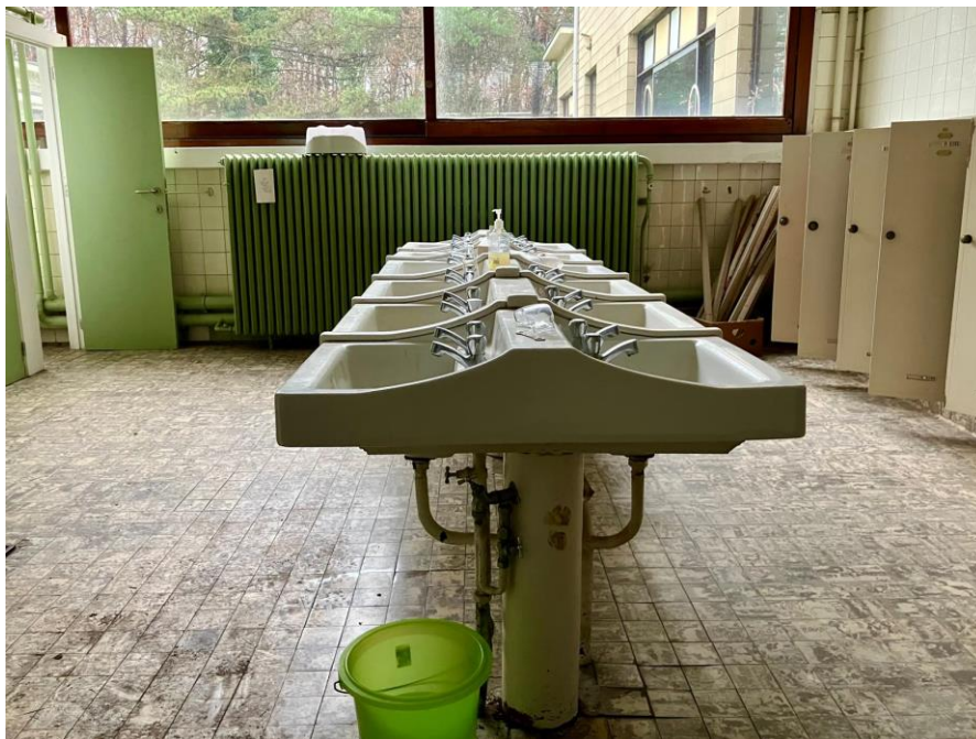
Afbeelding 5: detail interieur