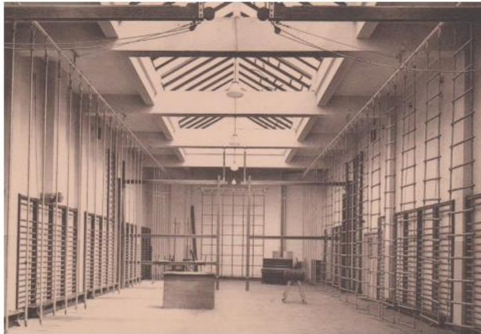
Archiefbeelden van de turnzaal gebouwd omstreeks 1968

De openbare verkoop zal door de dienst vastgoedtransacties georganiseerd worden.